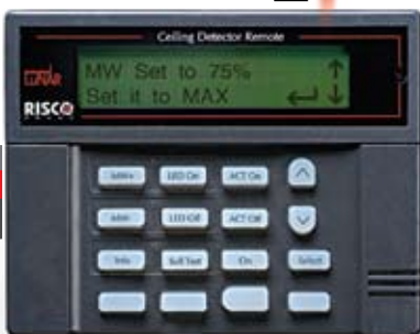
Optional Bi-directional Infrared Remote Control

Sistema de seguridad —mediante el teclado LCD o el software Cargar/Descargar.