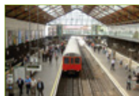
Estación de trenes